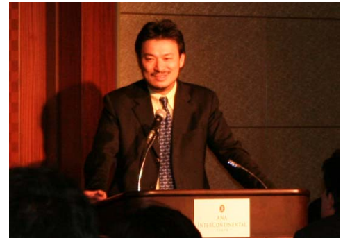
当日は、多くのベンチャー企業や上場企業の経営者ならびに役員の方々がご参加されました。